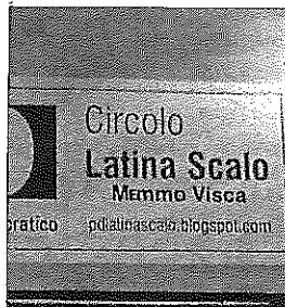
Il circolo del Pd di Latina Scalo