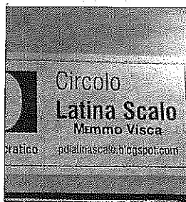
Il circolo del Pd di Latina Scalo